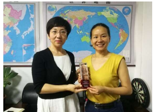
Signature de la convention à Pékin cet été avec Mme G, directrice de la Fédération Chinoise de Qigong Santé

Une chance extraordinaire pour les amoureux du Qigong, la ville de Brest nous accueille officiellement au salon Richelieu le jeudi 24 : venez nombreux vivre ce moment !