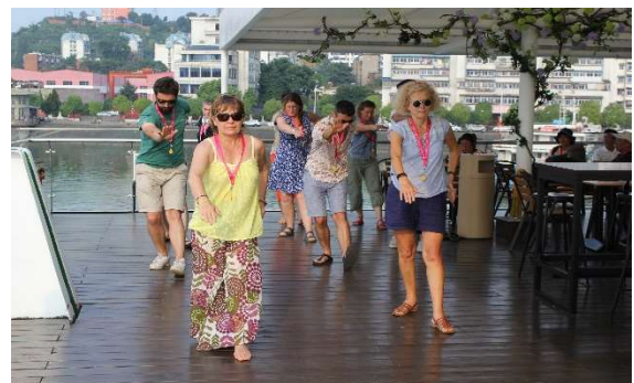
Pratique en croisière sur le Yangzi Jiang