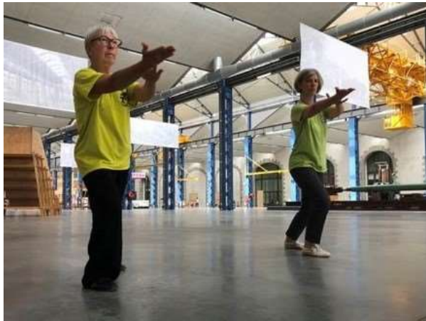
Répétitions aux Capucins

La coupe de France de Taijï et de Qigong se tenait, cette année, à Pessac, près de Bordeaux, début mars. L'École Wushu Brest présentait 5 élèves pour le Qigong, dans des épreuves individuelles et en équipe. Le 2e jour, 3 élèves se présentaient dans des épreuves individuelles de Taijï. Les résultats furent au rendez-vous dans les 2 disciplines.