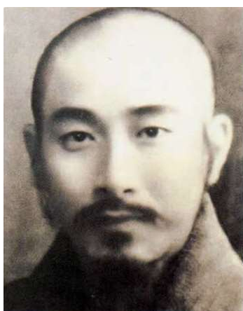
NAN Huaijin, 1945

Nous avons eu l'honneur de visiter ce monastère et l'école, guidés par un charmant moine Chan : explications de chacune des statues (dont celle de Wei Tuo, le gardien du temple ; l'occasion de mettre enfin un visage sur la figure des premiers mouvements du Yi Jin Jing), poèmes chantés du maître des lieux, NAN Huaijin. Visite de son appartement (construit pour l'accueillir mais qu'il n'a jamais pu occuper, mort trop tôt en 2012, à l'âge de 95 ans), etc.